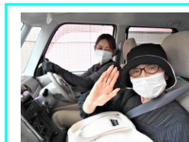
ありがとうございました！

まみこさんの密着記事いかがでしたか？ありのままのひまわりを知っていただければと思います。お褒めの言葉も率直なご意見も隠すことなくお伝えしました。「ひまわりってこんな所なんだな。」と感じていただければ嬉しいです。