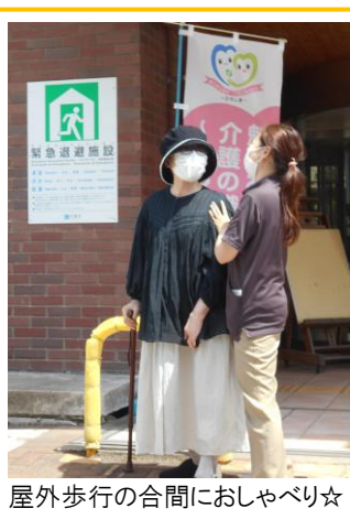
屋外歩行の合間におしゃべり☆

健康チェックを済ませ、機能訓練です。自宅での生活を続けられるよう機能訓練指導員(理学療法士・作業療法士)と運動をしています。「ひまわりでは屋外歩行や階段昇降など、実生活に沿った運動をしています。運動だけでなく、職員さんのおしゃべりも楽しみのひとつです！私は人見知りなんですけど職員さんがご自分のことを話してくれるので私も話しやすいです。」