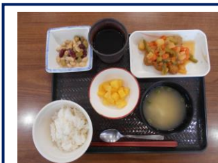
メインは肉団子の中華甘辛煮