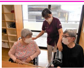
「おはよう！」「元気だった？」