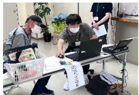
写真1 理学療法士からのアドバイス

※この写真の掲載につきましては、ご参加いただいた方のご了解をいただいております。