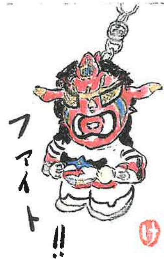
ひまわり班の作品