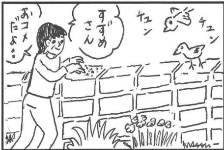
Hoto ひといき (No.8 マン画ヤヨイ)