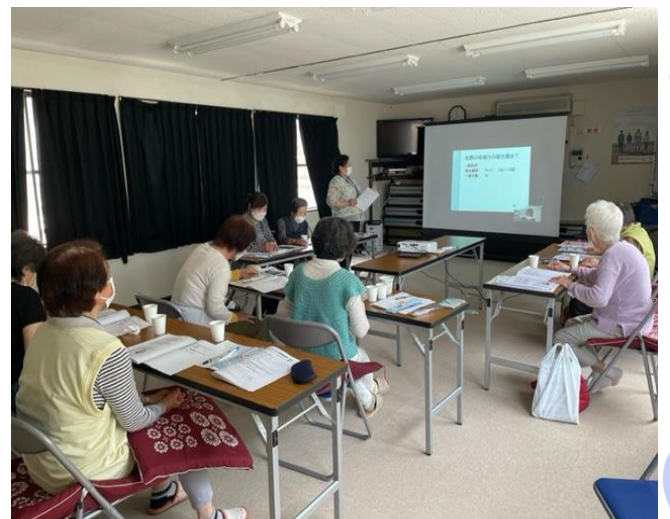
総会で「塩分について」を学んでいる様子