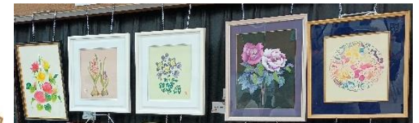
3/15,16の高屋西地域交流会で作品展示