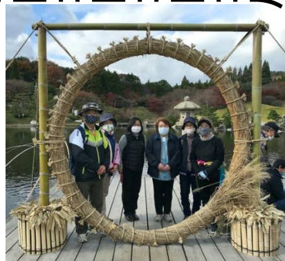
「茅の輪」を無病息災や厄除け家内安全を祈願しながらくぐる

※2020年10/30～11/23「もみじまつり」があり、週末には夜間ライトアップも実施されていたそうです。