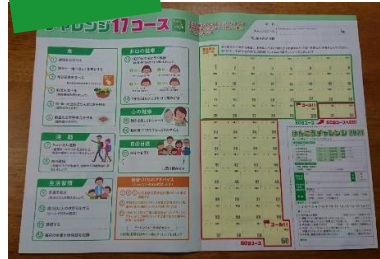
チャレンジ記録シート、報告カード付き

「からだとくらし」6月号の表紙にも出ていた 「けんこうチャレンジ 2021」を今年はためしてみませんか？