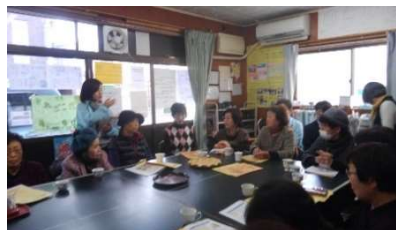
(16名参加) 組合員センターで