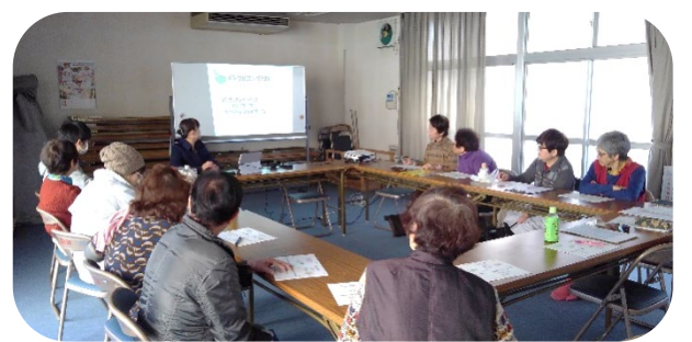
11月けんこうカフェ