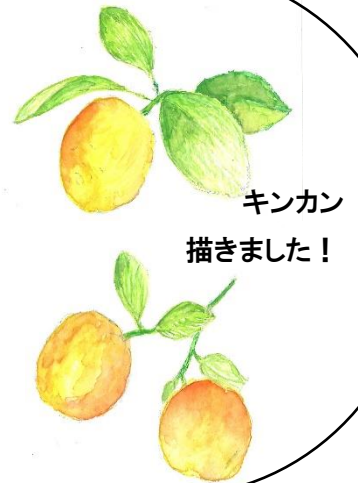
キンカン 描きました!