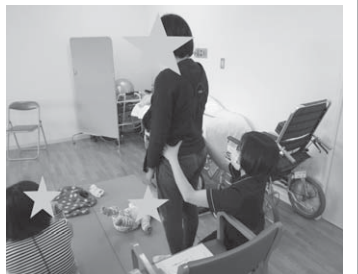
▲抱っこ紐の調整をしているところです