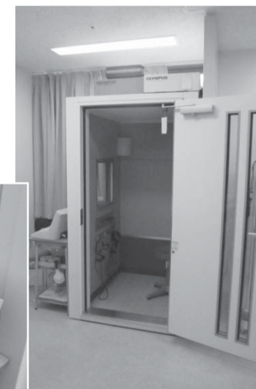
▲聴力オージオメーター