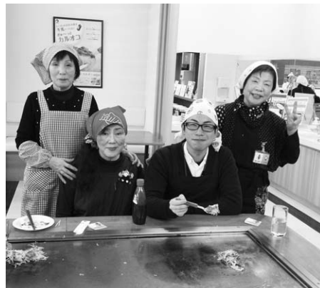
▲組織担当と支部役員さん、自作のお好み焼きを食べながら