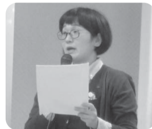
▲戦争法に反対するママの会の活動(職員)

十二月七日(月)、虹の会館ほつこりこりで平和冬のつどいを行いました。参加者は六三名(組合員四三名・職員二〇名)で、過去三年で最多でした。中筋支部のすてきなハンドベル演奏でスタート、平和ゼミナールの活動二年目職員・戦争法に反対するママの会の活動(職員)で若者の豊かな平和活動について報告してもらいました。