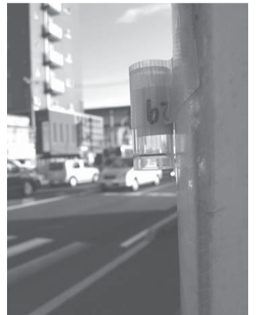
▲測定したい場所に専用容器を取り付け、24時間設置後回収しました

NO2は酸性雨や光化学スモッグを引き起こす原因物質であるため環境基準が「1日平均値が0.04～0.06 ppmの範囲内またはそれ以下であること」と定められています。