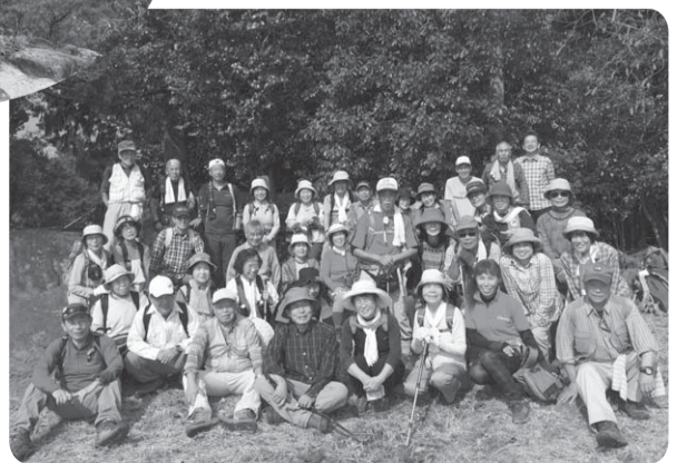
▲健脚揃いの老若男女の方々

《お詫び》 今回は「新年号」ということもあり、皆さんが楽しみにされていた『漢字クイズ』は紙面の都合上掲載できませんでした。次回(2月号)に掲載させていただきます。