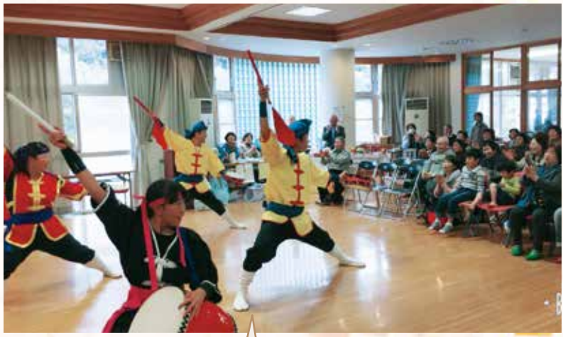
地元住民によるエイサー

11月6日、歌や踊りや体操の楽しいステージと、あったかい『豚汁』『さんまの塩焼き』で心もお腹も満足した一日でした