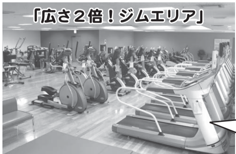
「広さ2倍!ジムエリア」

新施設のご紹介♪ 筋力系マシン12台⇒18台 有酸素運動系マシン15台⇒28台へ増大! 広い空間でゆったりと運動できます♪