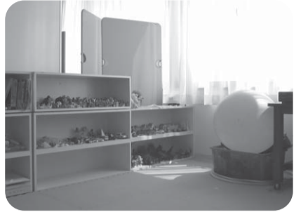
▲カウンセリングルーム

外来と入院の両方を行って いる唯一の医療施設であり、 常勤医師二名、非常勤医師一 名で診療を行っております。 病床数は特に制限を設けて いませんが、平均六名前後の 患者様が常に入院しており ます。昨年九月より新病棟と なり、個室が増え、室内も新 しく綺麗になりました。昨年 の外来患者数は七三三三名、 入院患者数は二一五五名で ありました。入院患者の主な 疾患は、気管支炎、肺炎、胃腸 炎などです。外来は、一般的 な呼吸器疾患(感冒、咽頭炎、 気管支炎など)、消化器疾患(胃 腸炎、食中毒など)、ワクチン 接種から、気管支喘息やアト ピー性皮膚炎、食物アレルギー 、低身長症、夜尿症、てんか ん、心身症(不