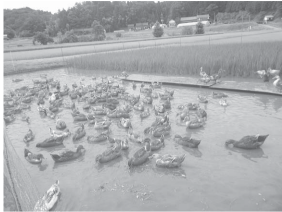
▲田んぼから引き上げたアイガモたち