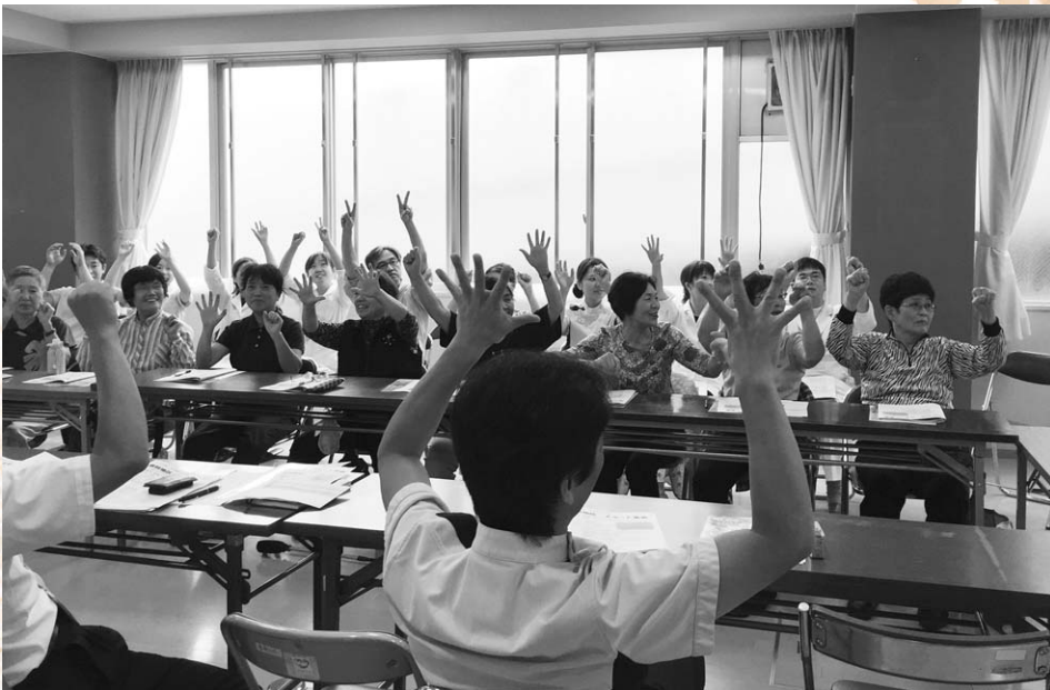
▲頭と身体をほぐして和やかな雰囲気です歯科地区スタート集会!!