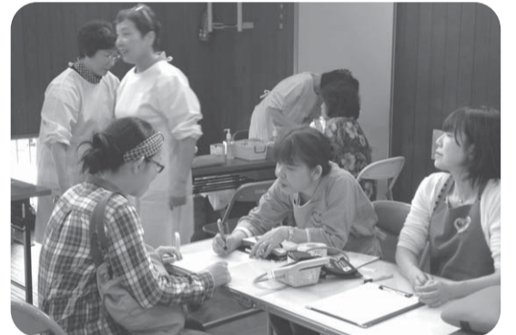
▲伴東けんこうまつりで職員と組合員さんと、健康チェックや肝炎ウィルスチェックなど行ないました

行っています。訪問診療も四〇件の患者さんを二人の医師で回っており、訪問看護やケアマネージャー等と連携して自宅で療養される方の支援をしています。デイサービスは定員十八名ですが、いつも満杯になっている状況です。三年前より患者会を