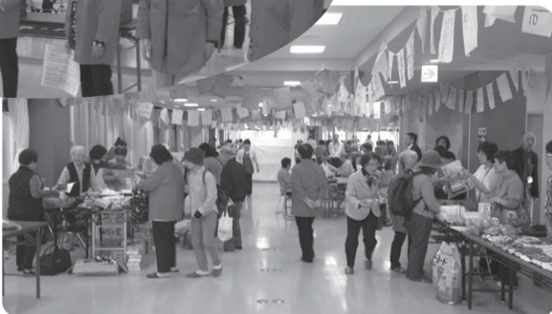
▶バザーもにぎわいました