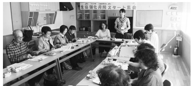
▲ふれあい地区スタート集会ではベア職場と息ぴったり

健康づくり活動で は、健康チャレンジ(十 月～十一月チャレンジ 期間)を地域で500件、 職場では310件、郵送 で200件の合計で1000件 を超えています。生協 強化月間の残り期間 も「健康で住みやすい まちづくり」に向けて、 組合員と職員が力を 合わせ取り組みます。