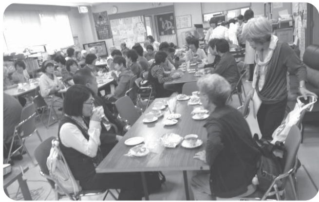
▲あすなる地区スタート集會に64人が参加

りのおやつが好評です。また、新総合事業を見据えた取り組みとして、県生協連、近所にある生協ひろしまの