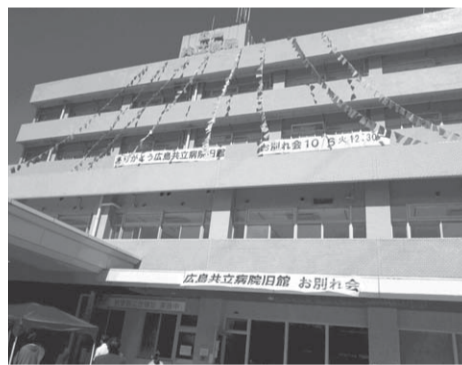
▲七色の旗に彩られた旧病院