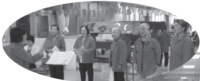
▲素敵な歌声を聴かせてくださったシャルウィコーラスの皆さん