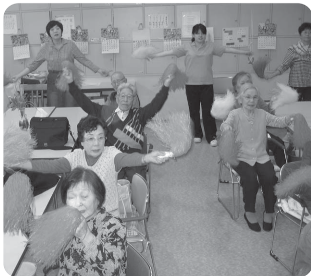
▲デイサービスでは、利用者さん・ボランティアさんと一緒に楽しく過ごしています

さんが誕生しました。今後地域の老人会の方とも交流を持っていきます。七月より、沼田診療所の近隣地域の組合員さん訪問を行い約三〇〇件回り、地域と診療所の