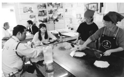
▲大人も子どももお得意さんのお好み焼き店