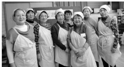
▲地域のたまり場として定着してきています

毘沙門台町内会福祉部が5年前より月1回第2日曜日9時半~11時に毘沙門台西集会所で、近隣の方が気軽に寄れる「カフェ」を開催しています。