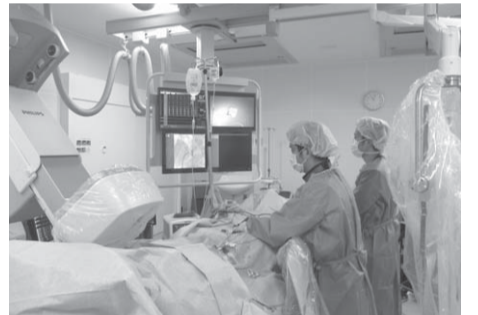
▲アブレーション手術中(不整脈治療)

に対する治療なども行っていました。 現在、月曜日から金曜日には共立病院で診療を行っています。月曜日午前中は外来、火曜日と木曜日はカテーテル検査および治療を行い、それ以外の時間は病棟業務を中心に行っております。土曜日は伴中央の伊藤内科医院で父とともに診療所での外来診療を行っています。 患者さんにより良い医療を提供する上で最も大切なことは、「その患者さんご自身が納得していただくこと」です。例えれば高血圧症の治療ひとつをみても、「取りあえず薬を飲んでおけば大丈夫」程度の理解しかしていただけないと、「将来の脳卒中や心筋梗塞を防ぐために二十四時間安定した血圧管理が必要だから自宅でもちゃんと血圧を測ろう」とまで理解してもらっていないのでは、もちろんその患者さんの予後もかなり変わってきます。