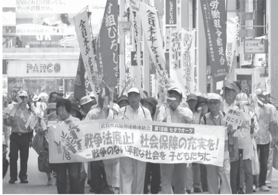
▲90名がシュプレヒコールでアピール

ンに掲げていましたが、今はむしろ「自助」「家族の責任」が叫ばれています。統計的には介護保険は全ての人が使う制度ではありません。しかし、自分が使う身になるか分からないのも現実です。自分が使うとき、経済的にも精神的にも安心して使うことが出来る制度にしておかなければ、困るのは自分です。とても複雑で分かりにくい制度ですが、いろいろな機会を利用して介護保険の「云々」をたくさんの人に知っていただく取組を進めていきたいと思ひます。