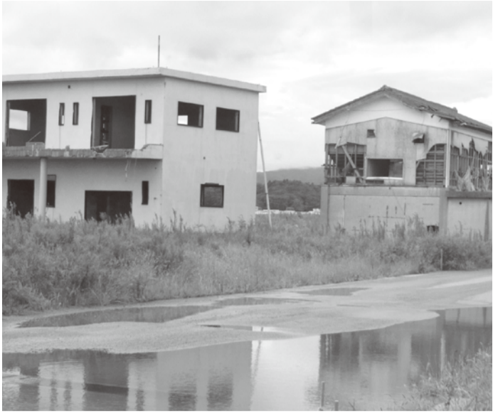
▲帰宅困難区域の姿

二〇一八年九月二十一日から三日間、民医連の第十一回福島被災地視察・支援連帯行動に参加。現地では被災地をバスでまわりました。相馬市、南相馬市などの帰還困難区域では、「ピートー！ピートー」と放射線の線量計が鳴り続けました。街には家やスーパースーパーが立ち並んでいますが人影はなく、