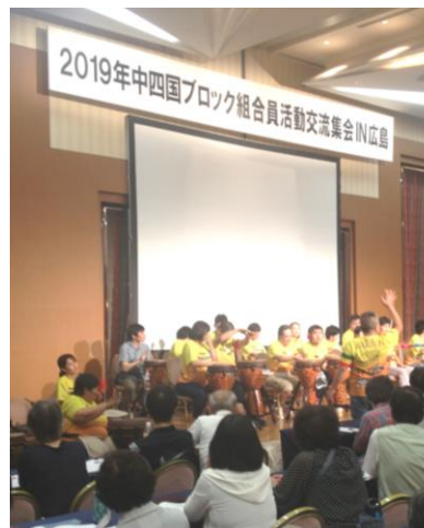
オープニング 社会福祉法人「あさみなみ」