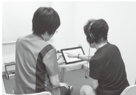
▶認知症機能チェック後もの忘れ相談中

検査のあとの結果説明で認知症についての心配事を聞き、お答えすることができました。また機会があれば地域で認知機能チェックをして、皆さんの認知症に対する不安を少しでも解決出来たらと思います。