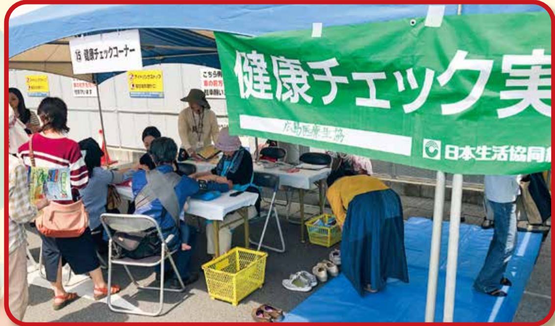
健康チェック 毎月