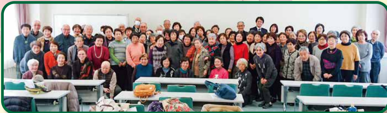
神田山荘でのレクリエーション(みんなで老後を考える会) 2月