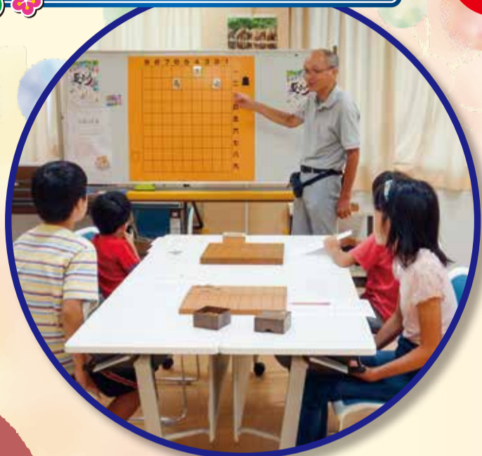
5年目を迎えた 「夏休み宿題応援塾」 7~8月