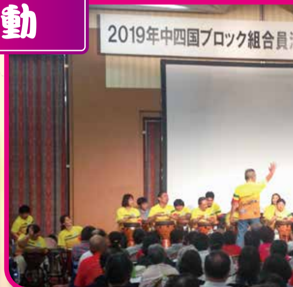
中四国ブロック組合員活動 7月16日・17日 (参加)