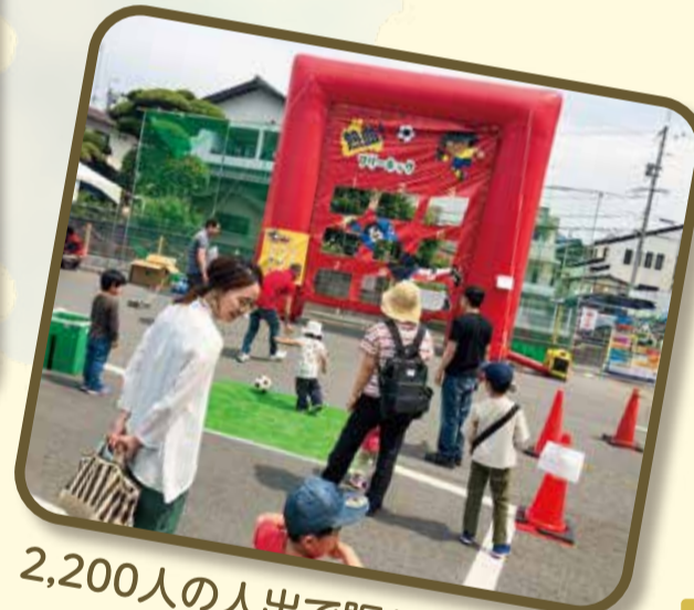
2,200人の人出で賑わいました!