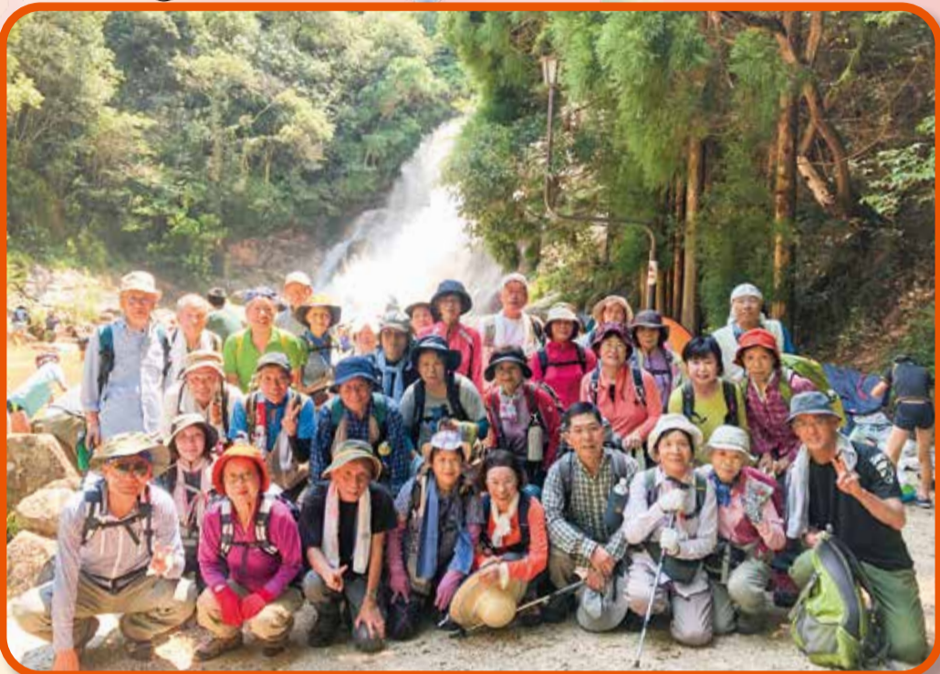
妹背の滝を背景に!(登山サークル月例登山) (毎月第4木曜)