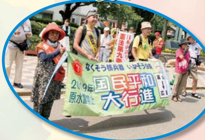
平和行進安佐南コース