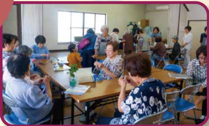
中筋お楽しみ広場 (毎月第4火曜)