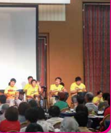
交流集会in広島 (参加者430人)