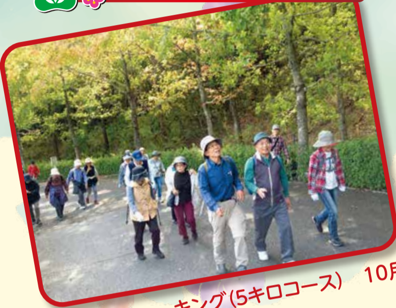
広域公園ウォーキング(5キロコース) 10月