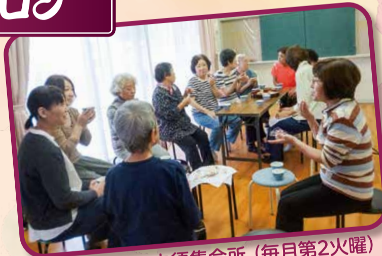
わいわいサロン中須集会所 (毎月第2火曜)