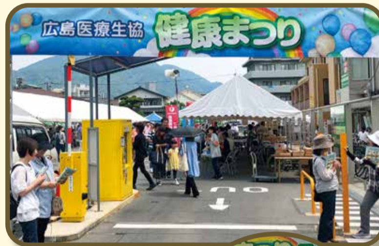
大盛況だった健康まつり 5月