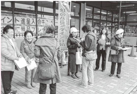
地域の店舗での署名行動