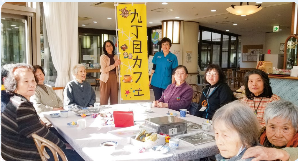
▲ようこそ、九丁目カフェへ!

二〇一九年九月からふれあいセンター協同の一階ホールで、「にじいろ保健室」を開催しています。