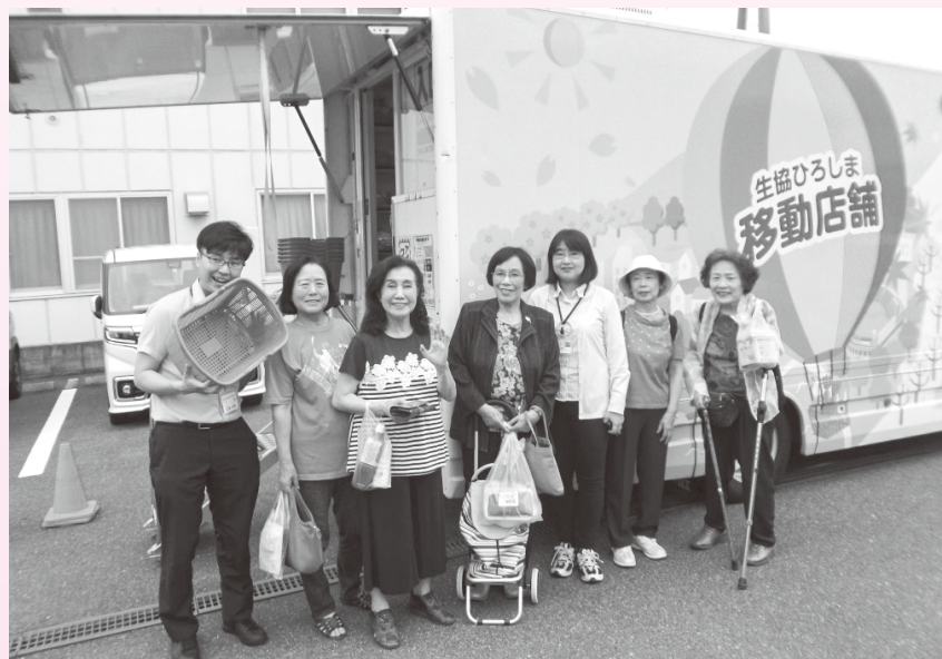
生協ひろしま移動販売車

組合員と職員がともに学ぶ「生協学校」を開催し、10名が受講しました。協同組合の原点を学び合い、実践に役立つ機会となりました。