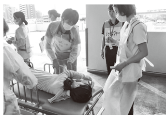
傷病者を重症度別に分ける訓練