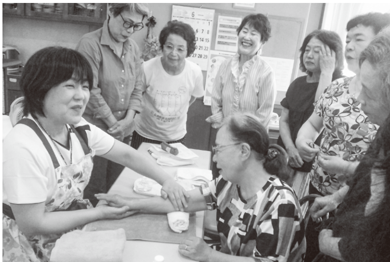
長束支部・すみれ班「ハンドマッサージ」