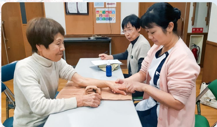
▲アロマ・ハンドトリートメントの様子