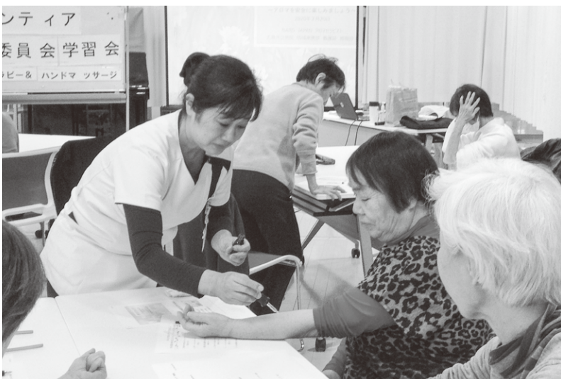
ボランティア学習会