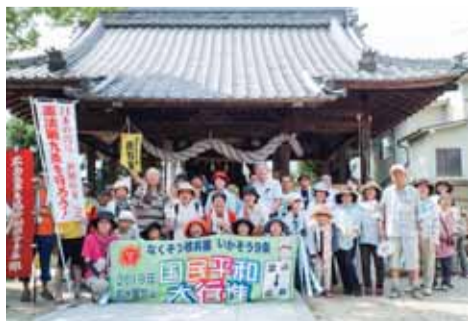
▲「2019年 国民平和大行進」。