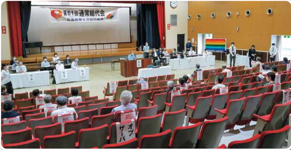
▲3密対策をとりながら開催

発行所 広島医療生活協同組合 〒731-0121 広島市安佐南区中須二丁目19-6 TEL(082)879-8124 FAX(082)879-8182 機関紙編集委員会 ホームページ www.hiroshimairyu.coop 健康まちづくりセンター(旧 組織部)Eメール sosikibu@urban.ne.jp