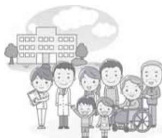
＜広島医療生協 5月の事業収益と患者数の前年比＞

自分達の事業所を守ろう！ 医療・介護従事者を応援しよう！ 地域医療と介護を守ろう！