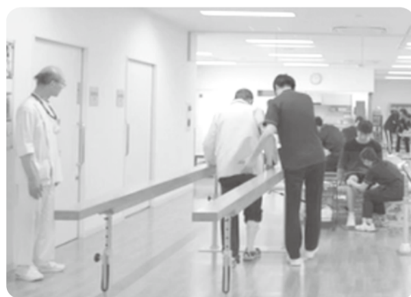
▲リハビリテーション室でのひとコマ