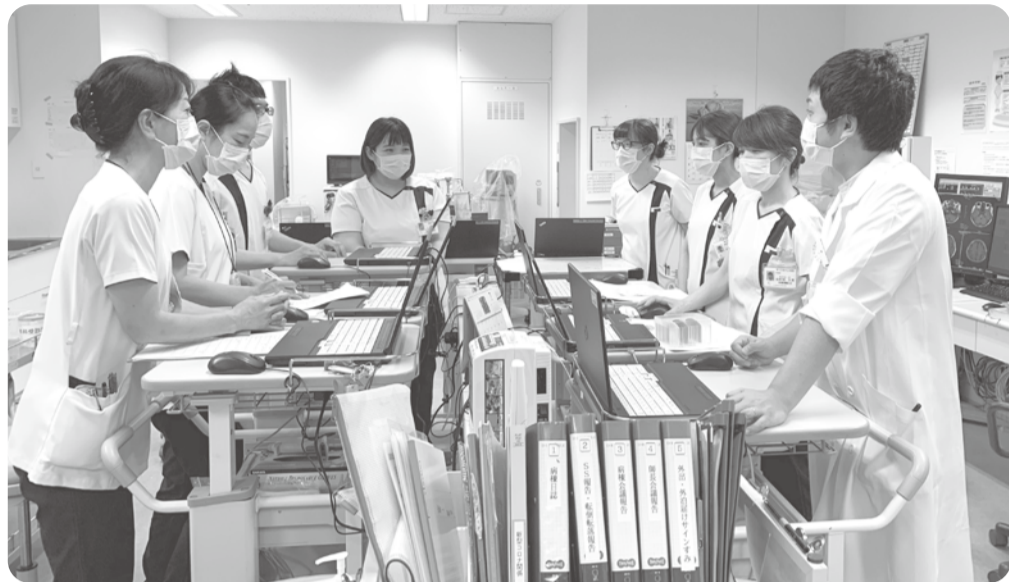
▲病棟スタッフとのカンファレンスの様子

来での痙縮(脳卒中や通所リハビリテーション)での診療、外来での痙縮(脳卒中)の後遺症でみられる筋肉の異常な緊張)に対