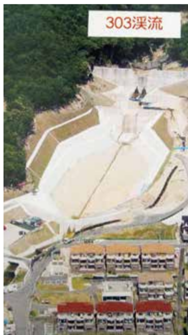
▲八木三丁目の砂防ダム

八木に出来た砂防ダムの下方にはダムから溢れた土砂を受け止める広大な堆積工という砂だまりも完成しました。さらに長束八木線と言われる避難道路が建設中で、道路下深さ20~30mの雨水渠という直径約5m長さ約1kmの地下トンネルに大量の雨水を溜めるようになっています。これらは想定される土石流と雨水に対処するもので現代技術の粋の結集でもあります。同時に自然災害の脅威には想像を超えるものがあり、すべてをダムだけで防ぐことには限界もあり、保水力ある災害の発生しにくい山林の保全も必要です。温暖化対策の推進やコンクリートに頼り過ぎない自然を活かした街づくり、ハザードマップの確認や避難訓練への積極的参加、自前の持参物の準備など災害に対する十分な準備が必要です。 (梅林支部 野間、八木支部 寺本)