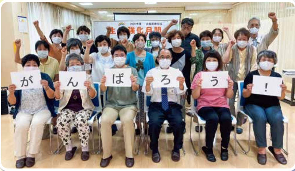
▲歯科地区 生協強化月間スタート集会