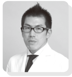
広島共立病院 小児科医長