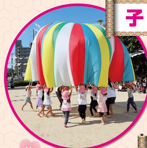
10月、共立ひよこ保育園とどんぐり保育園で運動会。人数制限・時間短縮・保護者入れ替えなど、密を避ける感染予防をして実施し、大人も子供も笑顔が輝きました。