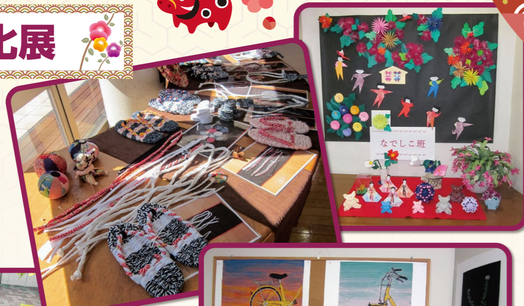
ふれあいセンター協同では、毎秋恒例のふれあいまつりの中止を決定したものの、もやもやしていた利用委員会のメンバーで何かできないかと考案したのが文化展です。期間を11月4日～12月2日に定め、班活動やデイサービス等で作成した作品をロビーいっぱい展示しました。