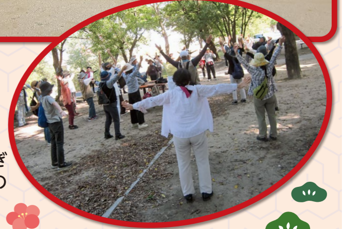
毎年恒例の秋のウォーキングは、ほっこり⇒せせらぎ公園を総勢55名でウォーキング。準備体操も近所の公園で行うなど、3密防止に気をつけています。