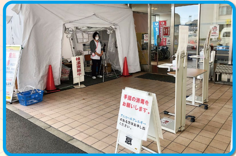
広島共立病院では、3月より新型コロナ感染対策として病院入口一本化と、入口での検温・手指消毒を徹底し、発熱外来を実施しています。