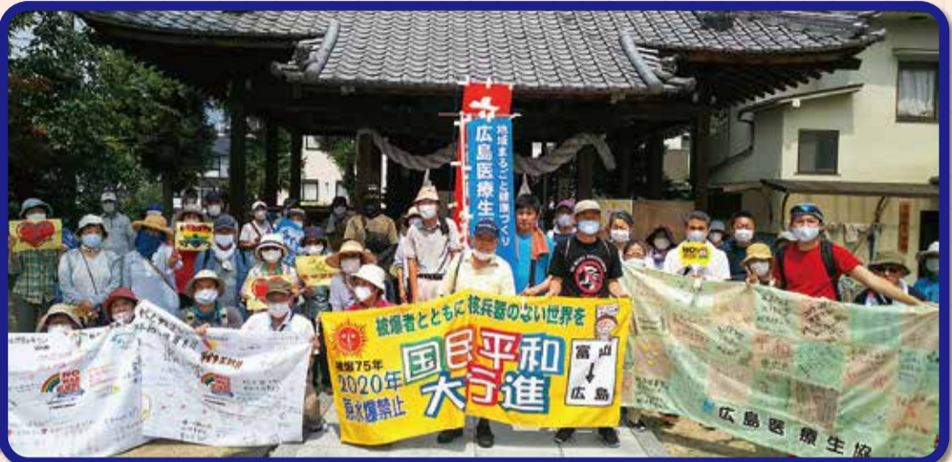
コロナ第2波の中、8月の原水爆禁止世界大会は史上初めて「オンライン」で開催。安佐南・安佐北平和行進は、感染対策を取りながら実施されました。