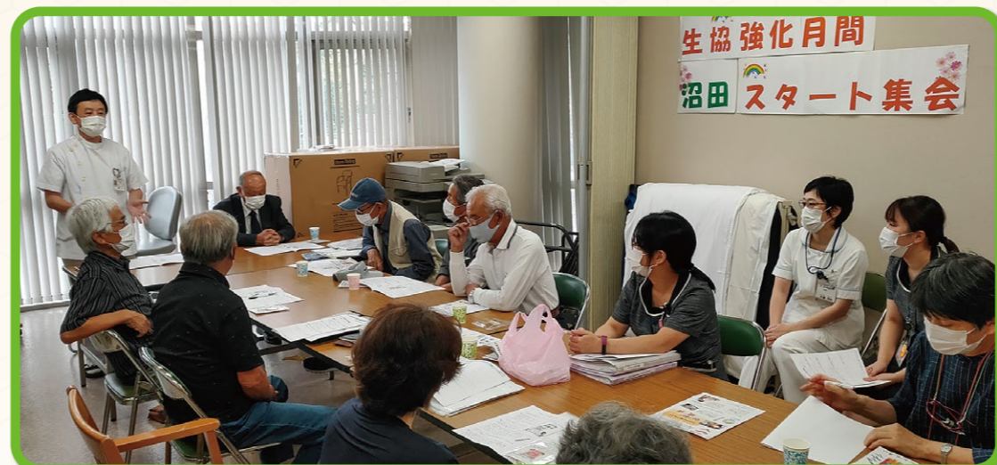
秋の生協強化月間(9/25～11/30)初日、沼田地区スタート集会を開催。組合員や職員から活発な意見が寄せられました。