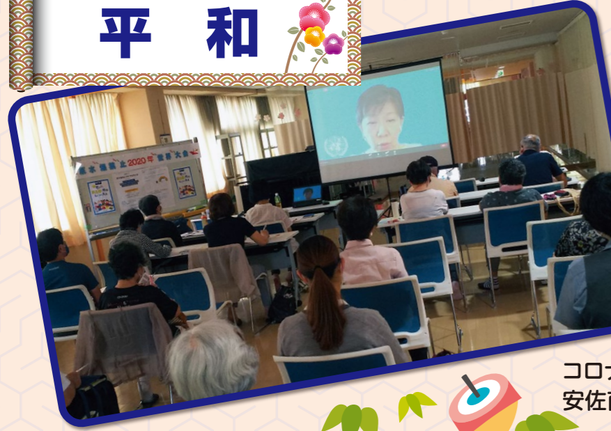
コロナ第2波の中、8月の原水爆禁止世界大会は史上初めて「オンライン」で開催。安佐南・安佐北平和行進は、感染対策を取りながら実施されました。