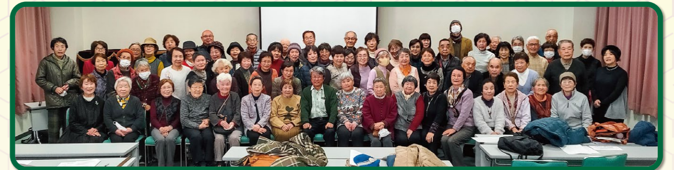
神田山荘での学習&レクリエーション。80名の参加で、防災士さんから災害への向き合い方を学習。その後は、食事とお風呂で楽しいひととき…(実施は2月)