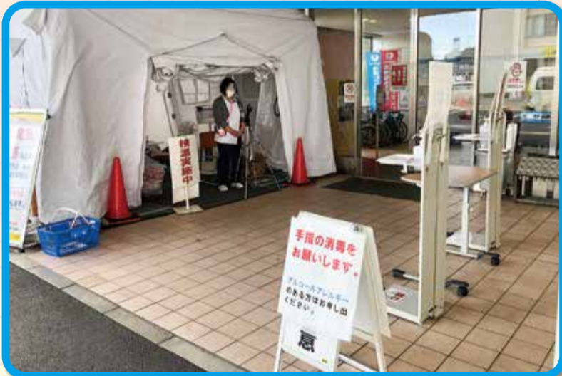
広島共立病院では、3月より新型コロナ感染対策として病院入口一本化と、入口での検温・手指消毒を徹底し、発熱外来を実施しています。