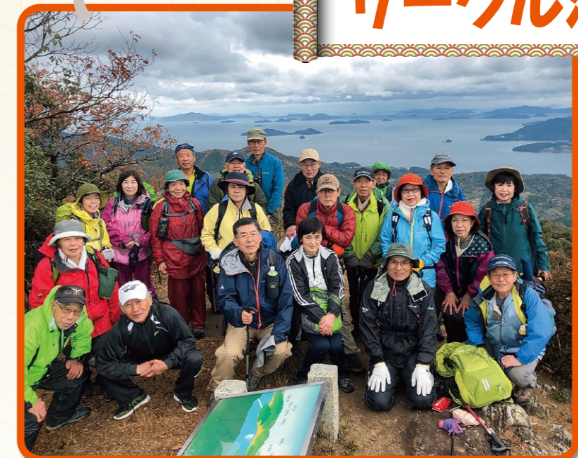
班会やサークル活動などは緊急事態宣言中は相次いで中止に。登山サークルも7月から再開。マスクをつけるなど注意して登っています。(写真は山口県琴石山)