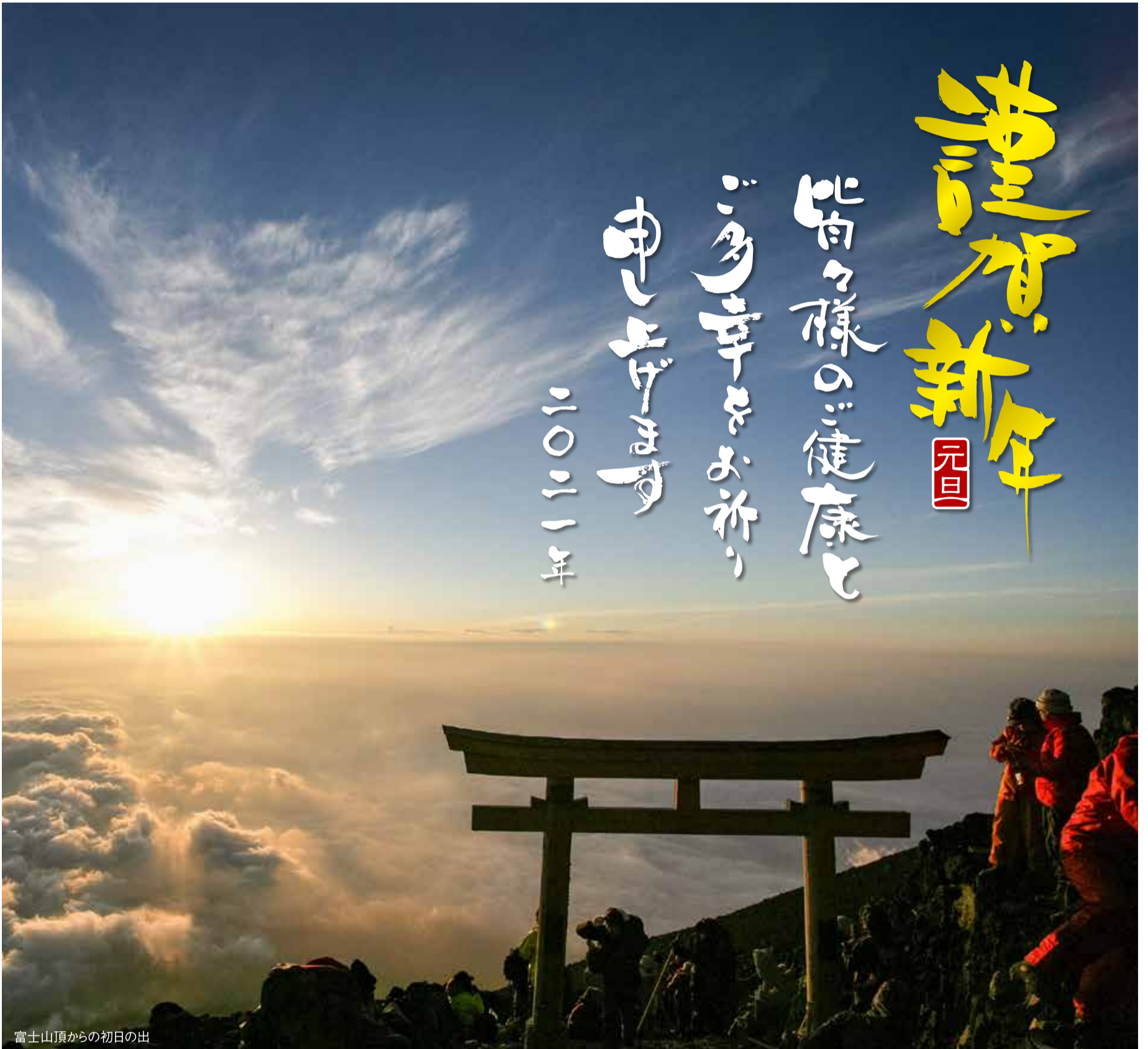
富士山頂からの初日の出