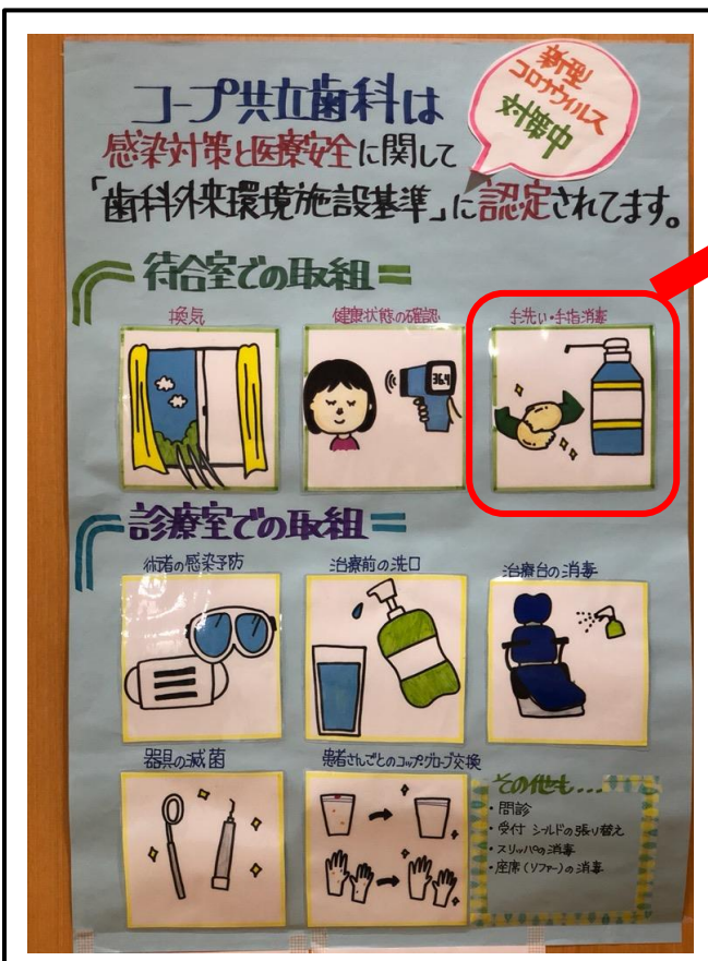
【手洗い・手指消毒コーナー】