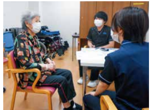
▲被爆証言の聞き取りの様子

広島医療生協ではこれまで、被爆者による被爆者証言集「ピカに灼かれて」を刊行してきました。2006年からは、2年目職員の聞き書きによる被爆体験記として引き継がれています。今年も2年目職員37名が被爆者の方に聞き取りを行い、編集しました。聞き取りを行った職員は、戦争の恐怖や原爆の悲惨さに衝撃を受けるとともに、次世代に受け継いでいくという強い使命を実感しました。