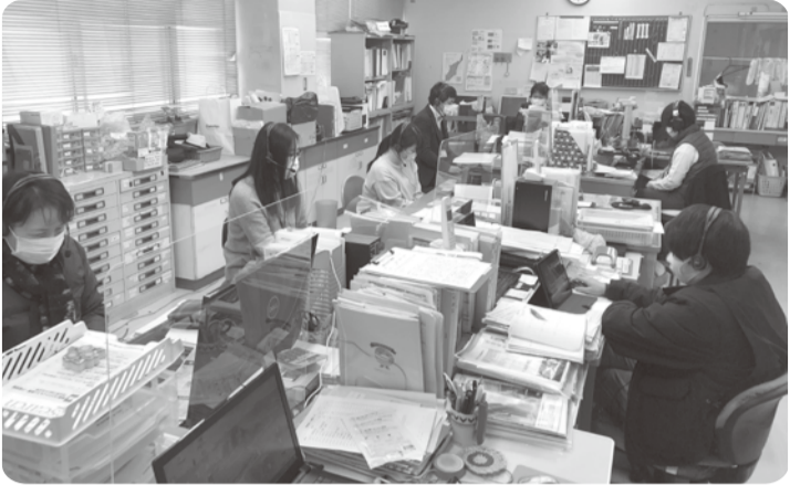
(朝礼や各会議はiPadを使ってオンラインで行っています)

「健康まちづくりセンター」は生協本部(虹の会館)にあります。長く医療生協に関わっている組合員さんには「組織部」の方が馴染みがあるかもしれませんが、3年前に名称変更を行いました。組合員活動のサポートをしています。現在、地域には31の活動支部、265の登録班、1,196名の組合員が班に所属しています(2020年12月末現在)。各支部では、支部長をはじめ多くの運営委員を中心に自主的な支部活動が行われています。組合員が集まり、健康づくりや助け合い、平和の取り組みのための活動が行われています。また、組合員が出資金を出し、事業所の利用はもちろん、意見や要求を出し合い運営にも参加しています。健康まちづくりセンターでは、「誰もが健康で、居心地よくくらするまちづくり」を目指します。これからも組合員活動のみならず、地域に貢献していきたいと思っております。