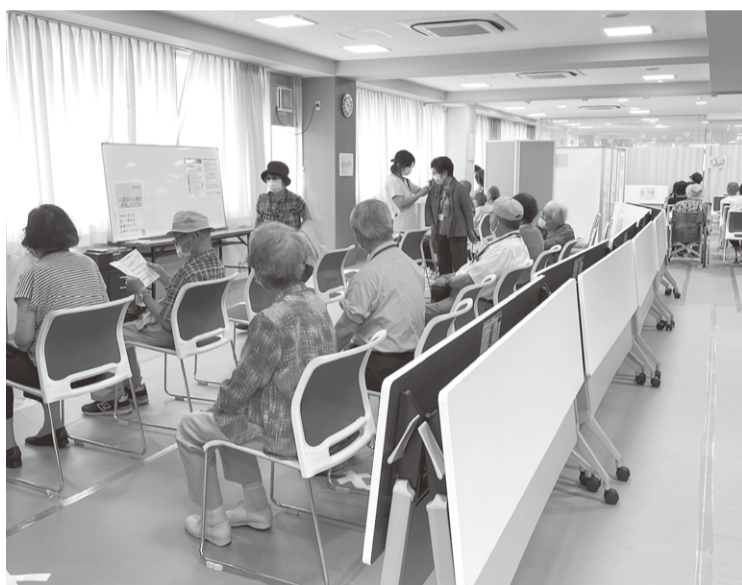
▲ワクチン会場 待ち合い・経過観察スペース

れた方、待ちわびている方が増えていく一方、接種をためらっている方もおられます。安全性と有効性が証明されて全世界で始まりましたが、「効果はわかるけど、副反応が心配」という方が多いと思います。多少副反応が多いワクチンですが、一時的なものであり、心配ありません。そ