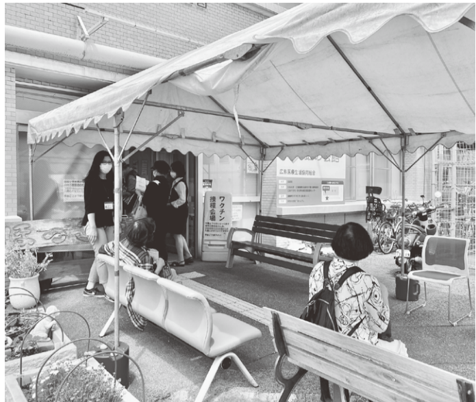
▲ワクチン会場入口(虹の会館1階ほっこり)

新型コロナウイルスのワクチン接種が本格化しています。広島共立病院では三月十日から医療従事者へ、六月一日から通院中の皆様へのワクチン接種を実施しております。大規模会場など接種会場は様々準備されていますので、ご自分に合った場所で受けて下さい。接種を済ませ