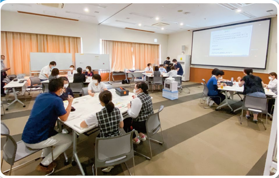
▲基礎的な学習もグループディスカッション形式で