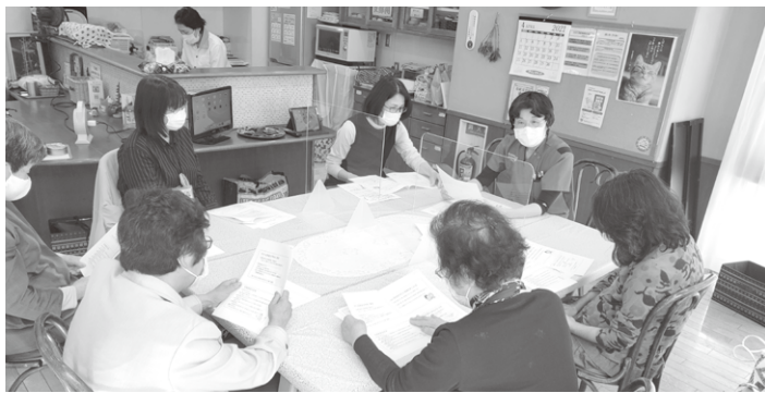
▲認知症のミニ学習会

大切です。認知症はある日突然発症するのではなく、何年も時間をかけて少しずつ脳が変性していきます。認知症になる数年前(MCIの状態)に気づいて認知症を予防することが長く運転を続けるポイントとなります。運転に必要な能力は、