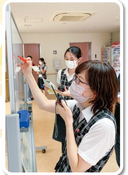
▲トランシーバーを用いた通信訓練

研修は、広島県のD M A Tメンバーに講師を務めていただき、災害拠点病院の役割やロジスティクスの基本的役割の学習、災害時記録やトランシーバー・衛星携帯電話の実機を用いた実習を行いました。二日目には総合演習という形で災害対策本部と救急外来の指揮所に分かれた実