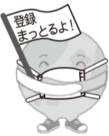
広島医療生協 イメージキャラクター「ギョツとちゃん」

広島医療生協公式LINEでは、組合員活動や医療・介護・保育の情報、健診センターからのお役立ち情報などを発信しています。色々な情報がリアルタイムに届くと好評です。登録されている方に下記のような記事がよく読まれています。登録しても管理者以外とつながることはありません(管理者にも個人情報送信されません)。