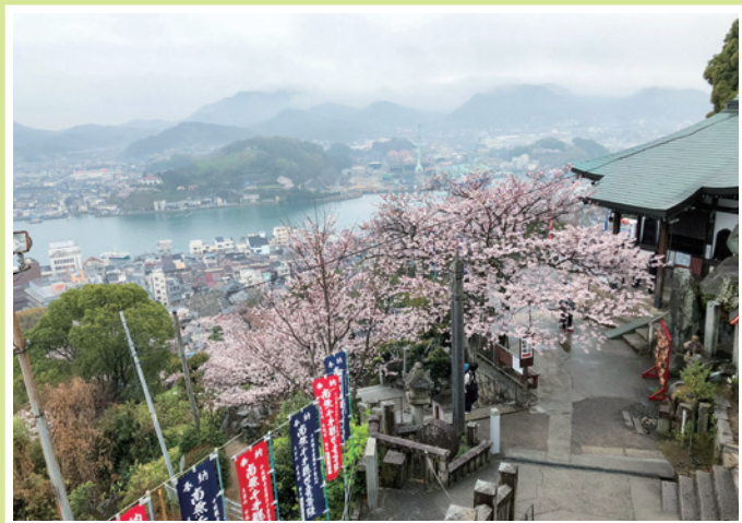
▲千光寺より尾道水道を望む