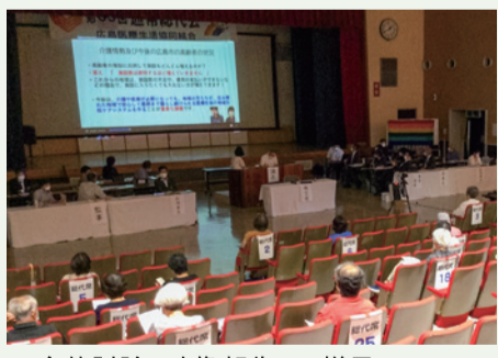
▲全体討論(映像報告)の様子