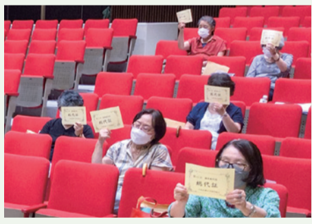
▲支部代表総代による採決の様子

昨年時間短縮のため行われなかった全体討論では、事前録画を上映し①定期巡回・随時対応型訪問介護看護の開設について②黒い雨プロジェクト活動報告③東広島つながりセンターによる報告がありました。また、新入職員紹介、研修医あいさつも動画報告で行われました。次に、各議案に対して採決を行い、すべての議案が可決されました。