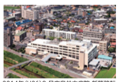
2014年(H26)9月広島共立病院 新築移転