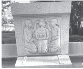
▲市立高等女学校の慰霊碑

原爆資料館の南側、一〇〇m道路を渡った平和大橋西詰川岸の木立の中にひっそりと佇むのが広島市立第一高等女学校の慰霊碑。戦後男女共学となり現在は舟入高校、筆者の母校でもあります。一九四五年八月六日、市立高女の一、二年生たちはこの辺りで建物疎開作業(建物取り壊し)をしていて被爆。職員・生徒六七六人全員が犠牲となりました。これは一校の学徒被災として