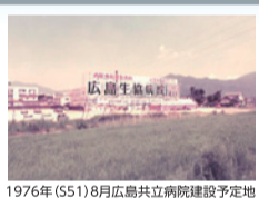
1976年(S51)8月広島共立病院建設予定地

お問合せ: 広島医療生協「健康まちづくりセンター」 TEL: (082) 879-8124 FAX: (082) 879-8182 メール: kenmati@hiroshimairyu.or.jp