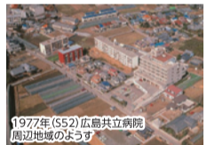
1977年(S52)広島共立病院 周辺地域のまうす