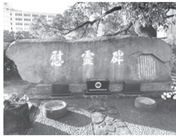
▲県立第二中学校の慰霊碑

平和公園内の国際会議場西側、本川土手に建てられた横長の石碑が県立第二中学校(現 観音高校)の慰霊碑です。あの日、建物疎開作業に駆り出された県立二中の一年生男子生徒たち三二二人は、ちょうど本川を背に爆心地の方へ顔を向け、二列横隊で整列し点呼を取っていました。米軍戦闘機(B29 エノラ・ゲイ号)が広島市上空に入ってきたのが見え、「B29がどっちに行くかよう見