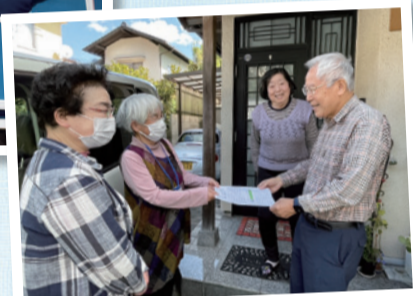
▲長束支部 地域訪問の様子

9/21 黒い雨相談会 黒い雨プロジェクトに亀山支部が積極的に関わって、被爆者健康手帳の申請に関わる相談会を初めて開催しました。12月にも開催予定です!