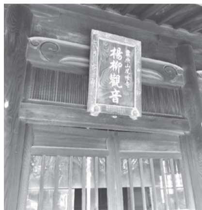
▲西原尾喰寺 楊柳観音本堂

広島医療生活協同組合の地、安佐南区西原のふれあいセンター協同近くにあるのが冬木神社。別名「尾喰寺」と言われるのには次のような由来があります。鎌倉時代、承久の変(一二二一年)の戦功により安芸四郡(安南・安北・佐西・佐東)を貰い受けた甲斐(山梨県)の武田信隆が安芸国司として下向する途中、近江(滋賀県)のある川を渡る時にふと馬の尾に食いつくもの