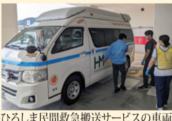
ひろしま民間救急搬送サービスの車両