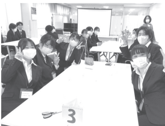
チームビルディングとして「マシュマロチャレンジ」に挑戦