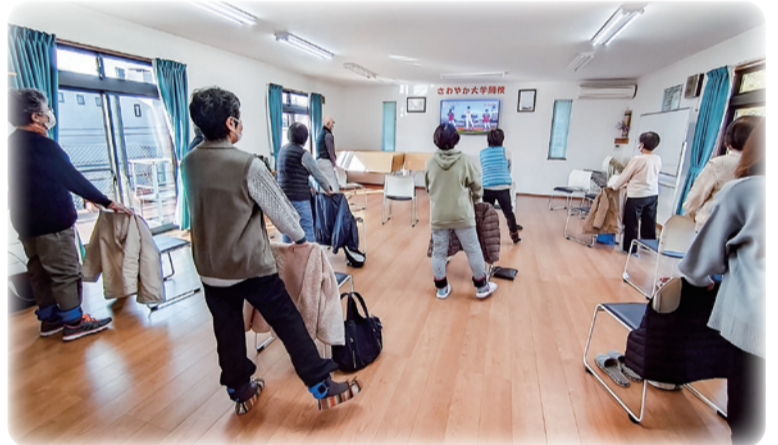
▲「毘沙門台東 ほほえみ会」の百歳体操の様子

ちなみに広島市内には四十一ヶ所の地域包括支援センターがあり、それぞれ担当圏域が決まっています。安佐・安佐南地域包括支援センターは古市小学校区、大町小学校区、毘沙門台小学校区、安東小学校区の四つを担当しています。