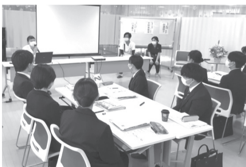
先輩職員との交流