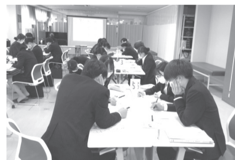
グループでの話し合い