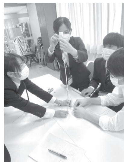
笑顔あり、真剣な眼差しあり、同期でのつながりが深まりました