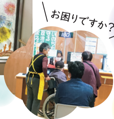
【受付で利用者さんを案内】

毎年開催されている「ボランティア養成講座」では、ボランティアとしての心構えや車椅子介助等の専門的な知識について学びます。今年度は十四名が参加しました。「家族が共立病院でお世話になったのでその恩返しをしたいため」家にこもり過ぎりの生活を変えたいため「将来夫の介護をすると思うので予備知識として知りたい」など受講理由は様々です。