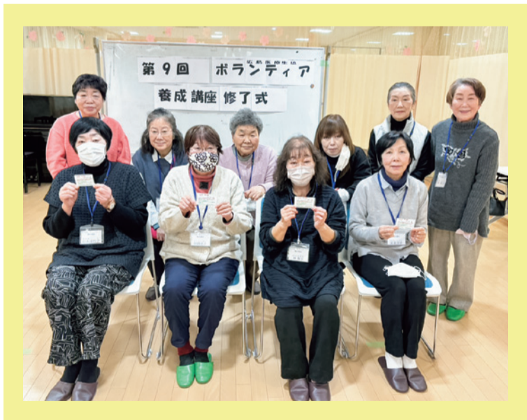
【ボランティア養成講座】

が、皆さん積極的に講義を受けられ、続々とボランティアデビューされ、既に各所で活躍しています。広島医療生協のボランティア活動は、誰もが持つ思いやりや心配りを出し合い成立しています。決して特別な活動ではなく、患者、利用者、ボランティア、職員それぞれが思い合い尊重し合うことによつて、昨日よりも今日が、さらに明日が、より一層意欲的に生きられると考えています。