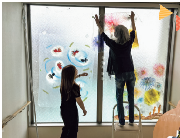
【緩和ケア病棟での飾り付け】