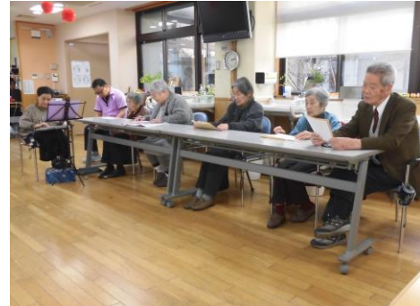
「富士山」「松竹梅」の2曲を吟じてくださいました。