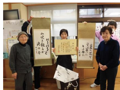
お二人が奨励賞に輝かれました

利用者様2名が、書道展で奨励賞に輝かれたとの嬉しいお知らせがありました。詩吟クラブの皆さんが発表会を開いてくださり、芸を披露してくださる利用者さんもいて、ひまわりでは賑やかに新年を迎えることができました。