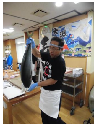
大きなぶりでした！