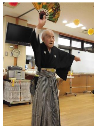
「祝賀の舞」を披露してくださいました。