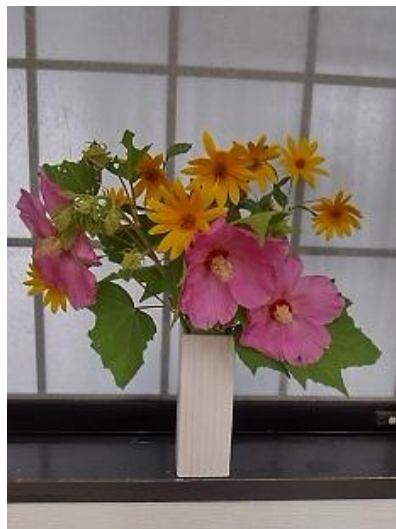
— 芙蓉と菊芋の花 —

「難聴」は、認知症発症に関連する要因(高血圧、高悪玉コレステロール、糖尿病、その他)の中でトップに位置している。「加齢性難聴」の対策として、補聴器は最重要ですが、最低 10 万円位とのこと。諸外国のように、公的補助が必要です。そのための要望書(署名)も提出することにしました。