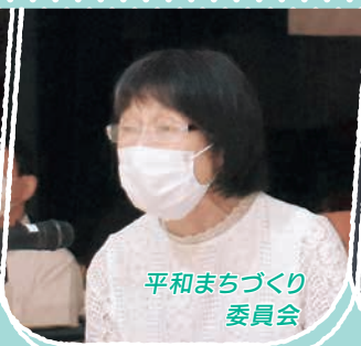
平和まちづくり 委員会