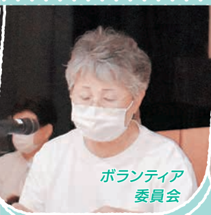
ボランティア 委員会