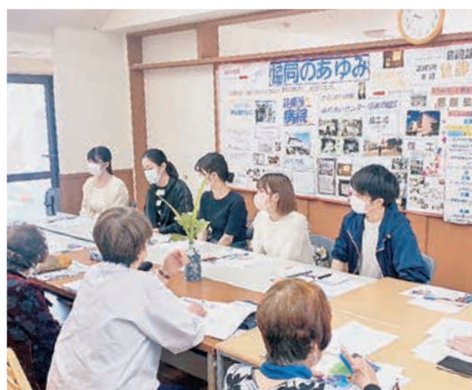
組合員との交流（ふれあい地区）

たり、こけんよ体操などの班 会を体験したりしました。組 合員さんから「困っていること はない?」「辛いときはいつで もおいで」などと声をかけてい ただき、とても嬉しかったとの 振り返りもありました。 地域の皆さん、これからも 温かく見守ってください。そし て新入職員の皆さん、忙しい 日々が続きますが、一緒に頑張 りましょう!