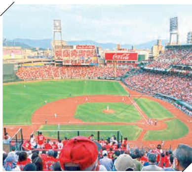
現在のマツダスタジアム

※本誌は広島医療生協ホームページに掲載されます(ペンネームでの掲載可)。お正月らしい写真を募集中！公式LINEに送ってください！