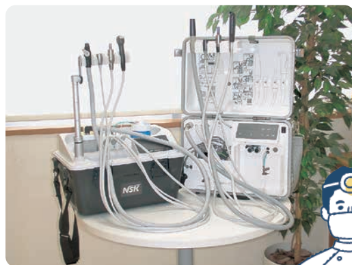
訪問診療用機器「ビバエース」

これからも、地域の皆さまのお口の健康を守り、【いい歯】で笑顔で過ごせるようコープ共立歯科一同サポートしていきます。